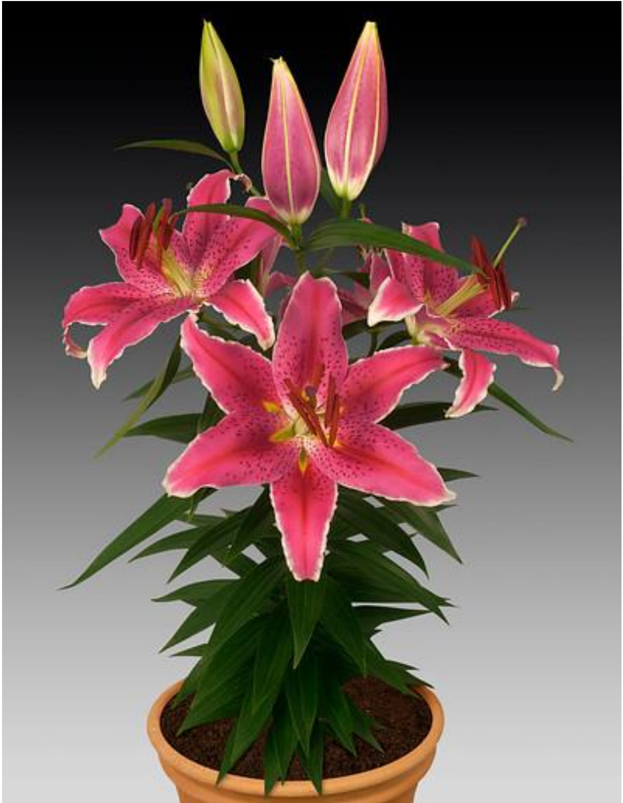
東方雜交型，盆栽類