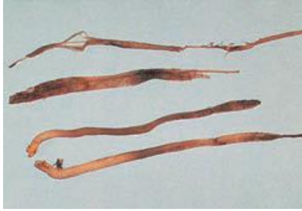
腐黴菌感染的根部