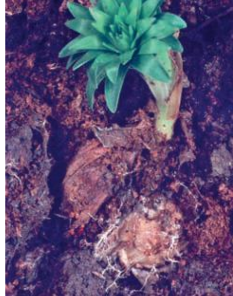
立枯絲核菌造成的葉片感染