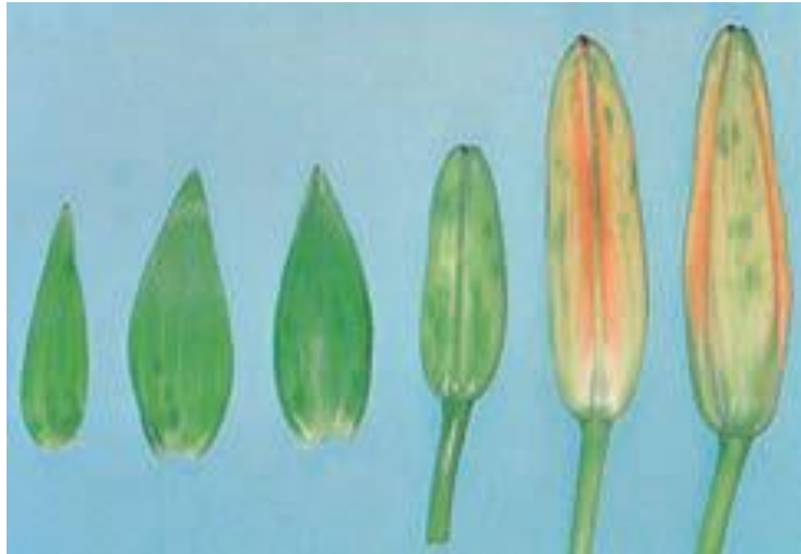
被蚜蟲危害的葉片和花苞