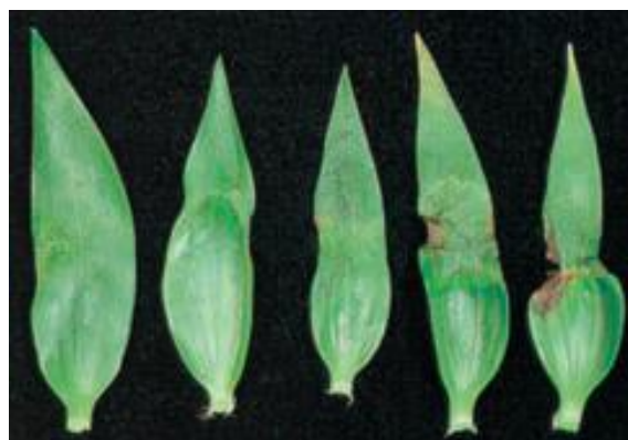
東方雜交型中的葉緣焦枯