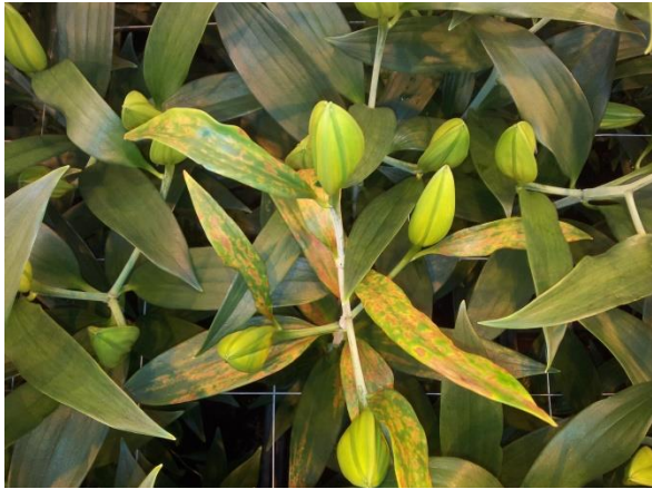
車前草亞洲花葉病毒