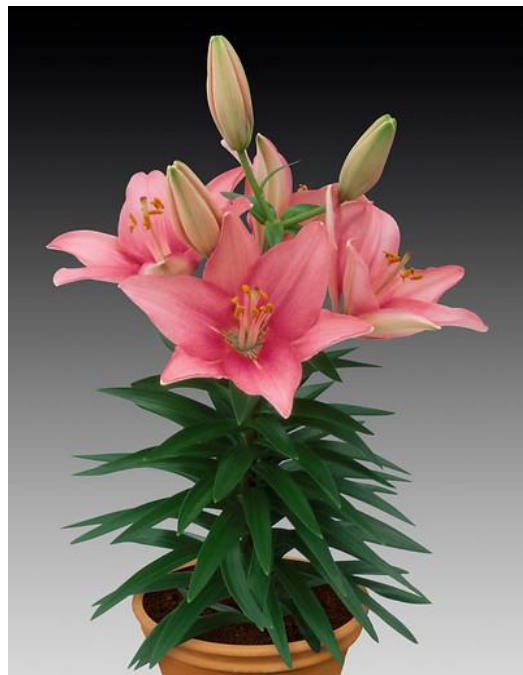
亞洲雜交型，盆栽類