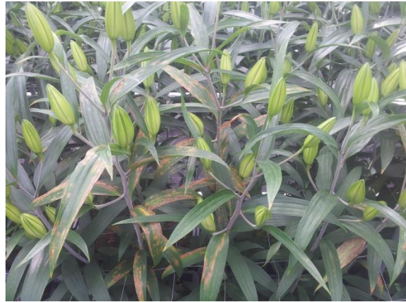
車前草亞洲花葉病毒