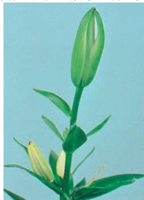
亞洲雜交型中的花苞發育不全

花苞乾枯在生長期的任何階段都可能發生。如果發生在早期，植株將比較矮，葉片呈暗綠色、短和窄，緊密地排列在莖上，但植株不會發生葉緣焦枯的現象。若在發育的早期部份或全部的花苞乾枯，以後在頂部葉片的葉腋處出現白色的小點。如果在植株發育的後期出現花苞發育不全，那麼植株通常會發育的正常，有正常的根部系統，而且可以清楚地看到花苞。然而，之後花苞會變為淺綠色並枯萎。如果花苞已經開始顯色，這時花苞的顏色會變淺並完全乾枯，但是通常不會脫落。花序頂端的花苞將首先表現出乾枯的現象。