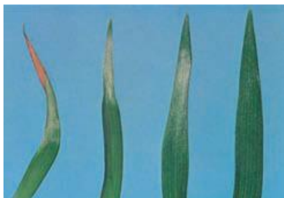
亞洲雜交型中的葉緣焦枯

（有時只在花托上發生）。當發生這種情況時，植株的頂部會生長得非常彎曲或變為黑棕色。這也可能發生在頂部花苞的花瓣上，從而導致花苞生長的不規則並從頂端開放。