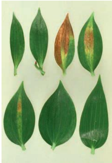
被感染的頂部葉片