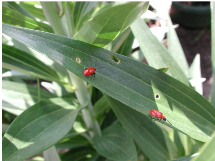
葉片上的百合甲蟲

百合甲蟲（ Lilioceris lili ）會蠶食植株的整個葉片。同時也會對花苞造成損傷。百合甲蟲會從葉緣開始啃食葉片。這種甲蟲的成蟲約8毫米長，呈明顯的亮紅色。被損傷的葉片外形不雅，因為它們會被一層很厚的深棕色黏液性物質覆蓋。