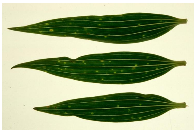
被薊馬損害的葉片

薊馬會在百合植株上產卵。在薊馬產卵后，植株會展現出一種過敏性反應：產生水滴樣混合狀的褐色斑點。這些斑點是圓形的，直徑只有幾毫米。花苞上也會出現這種病徵。由於百合並不是薊馬的寄主，所以植株的莖上不會出現咬傷。